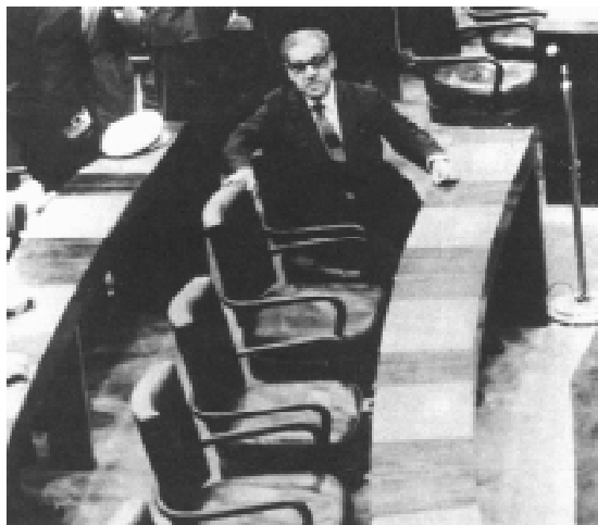
Presidente Costa e Silva.

O período que se seguiu ao AI-5 ficou conhecido, como “anos de chumbo”, não apenas devido ao fato de ocorrerem confrontos armados entre pequenos grupos guerrilheiros e forças policiais e militares, nos quais ocorreram mortes de ambos os lados, mas principalmente em uma alusão à falta de liberdade política e à repressão que atingiu um setor muito mais amplo da sociedade brasileira do que aquele envolvido na luta armada. A repressão desencadeada pelo governo resultou em prisão de opositores do regime, tortura e desaparecimento de pessoas.